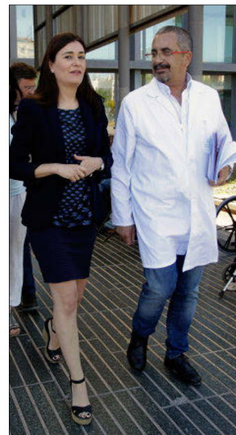
Montón y Sanchís. EL MUNDO

El nuevo equipo se ubicará en la ampliación del área oncológica que actualmente se está llevando a cabo y que estará concluida en primavera. La expansión del sótano en 1.576 metros cuadrados albergará equipos de tratamiento y diagnóstico del cáncer. Así, comprenderá las dependencias